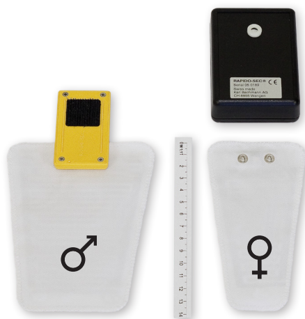
RAPIDO-SEC® Weckgerät kabellos

Unser Telefonservice steht Ihnen bei allfälligen Fragen oder Problemen während der ganzen Therapiedauer kostenlos zur Verfügung.